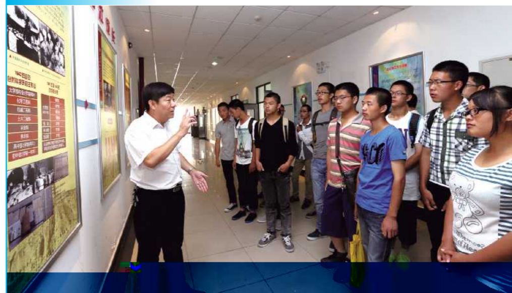
(文/校史馆 程明钰 图/新闻中心 郭强)