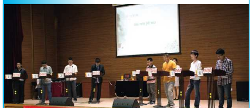
第三届中华传统文化知识竞赛总决赛

4 29! "#$%&' ( ) * +, - . / 01231456$ 789 : ; < = > " ? @ . / 01 ABCDEF GHI J $ KLMNO > PQJ R1S" TU* OVWXYZ [ P ( ) , - "\ ] NG^ P_ , ` a " bc 5d PGefghi 1j kl " $ mnopqr ? @ 01stuZvwX opqy NG^ z { | ( ) } ~ • 所以生生不息" 正A 因为# ^ ( ) , 明具 有, - 纵贯R" h 他鼓励U场PNG^ 要做一个厚< P_ " 全面P_ " 研究 G问" 追求幸福" 享受快9" h