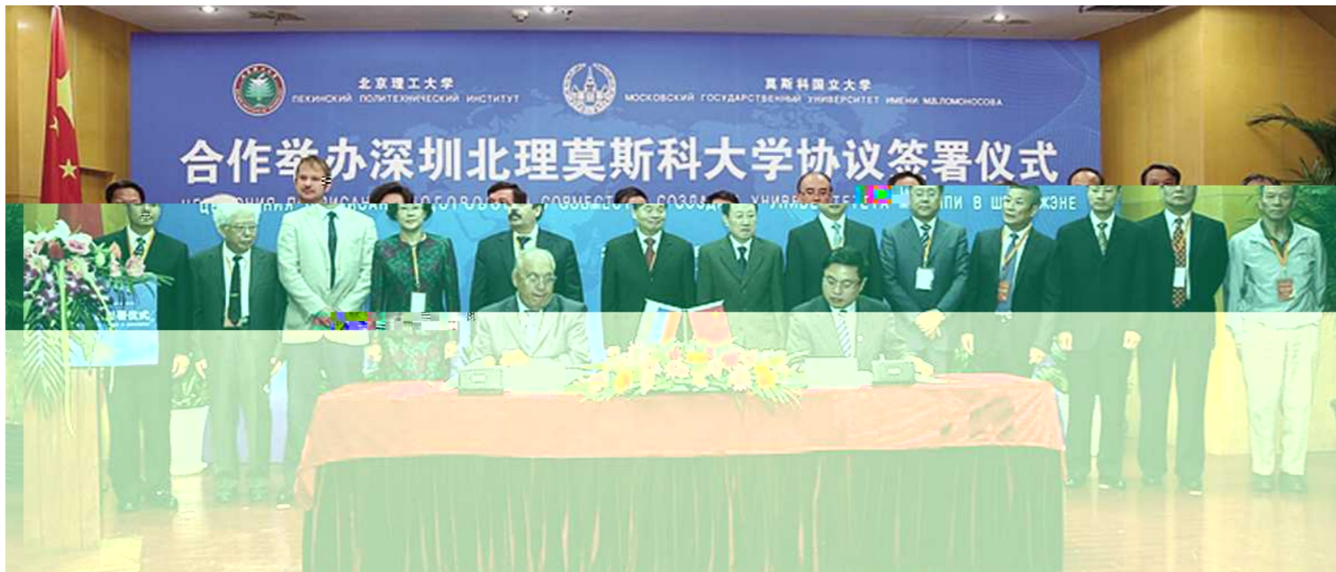
合作举办深圳北理莫斯科大学协议签署仪式