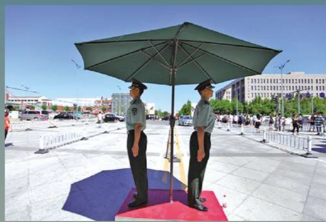
▲ 我为头顶天立地 为我保驾护航