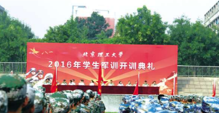
(文、图/军训指挥部 宣传组)

一^长Z[ [作?` 队教_y = 发{。" = , 7体教_将ct`守军e的有 和学校的管理, ] a工作^在em中c^组织_心指导^人u` j教_a 4.1化自A~J, 展现良形b, 5 c的军V本领和良的军人作N { GA教, P军e成 达 3R目标。