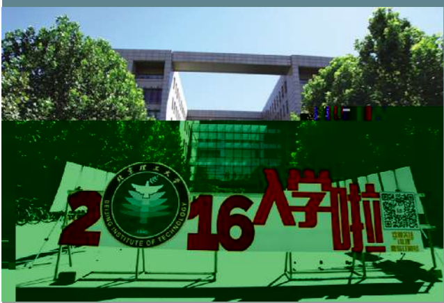
▲ 群人等这一天已经很久了

【编者按】金秋时节，北理工迎来了2016年8月26日，伴着金秋暖阳，北京理工大学良校“门若”，喜迎3827名来自全国各地的莘莘学子。“青春力量、朝气蓬勃，”“正气、斥道，”“将用心灵接受延安精神、用知识武装自己。北理工年轻的学子，青春拥抱梦想，唯愿大家扬帆远航”