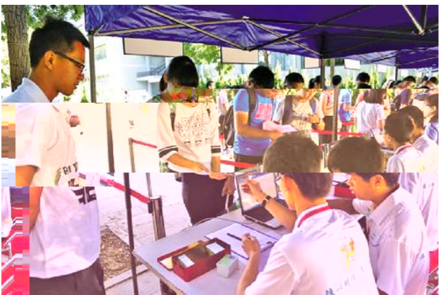
▲ 到卡通我终于可以 正言顺动起来