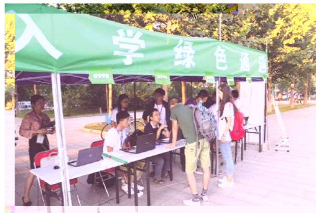
▲ 梦想起航 绿色通道 为经