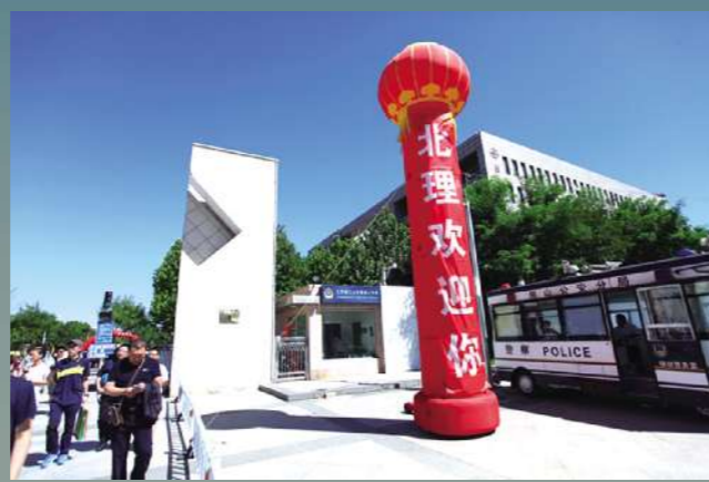
▲ 欢迎你为你未来开辟