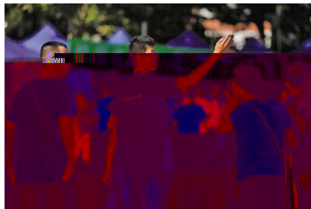
▲ 我右手边是综合楼里英语听训 类课程 演艺厅 告厅应尽有。