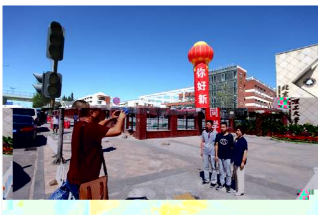
▲ 这里我立 我时