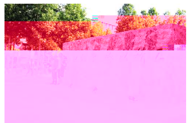
▲ 训是 人右。