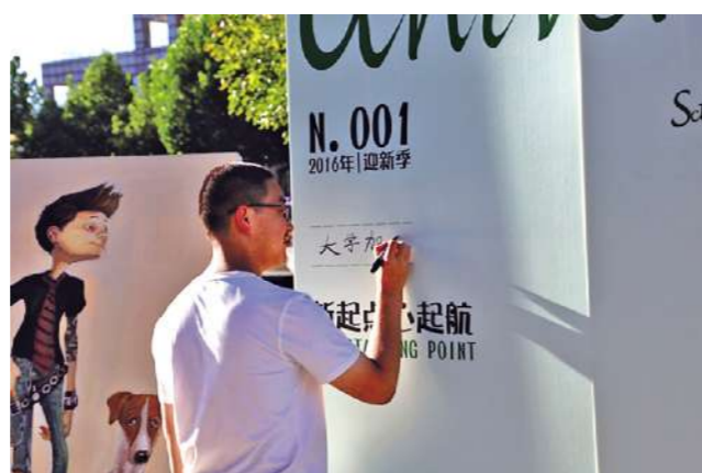
▲ 起 起航我 我