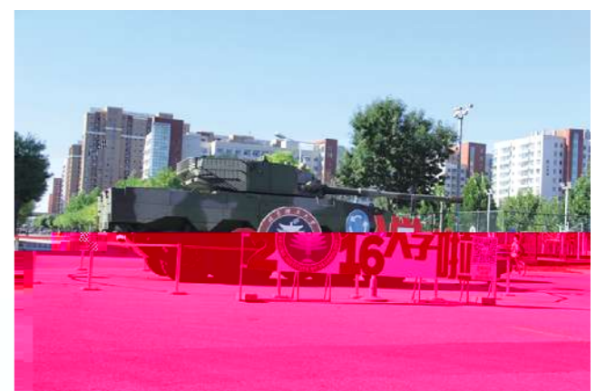
▲ 欢迎2016 到 我为了