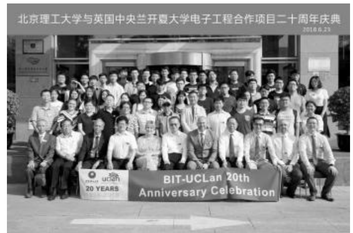
北京理工大学与英国中央兰开夏大学电子工程合作办学项目二十周年庆典

FG r > 。 _ ? 切 @ 1 { | ALM I , B L4 , C u , 9 DE F . w. Liz Bromley G a 5 史, u u 1998 , 20 HI b J b KL a 师 c 努. u前, 师 s, M | NO OPFA LM 9 ^ . Q p q , 5 , 89 M V, w` 5 RQ , SRQ = a T ] < UV . I Z 3 V W X YW* A, Liz Bromley W Y 7 R. ( )