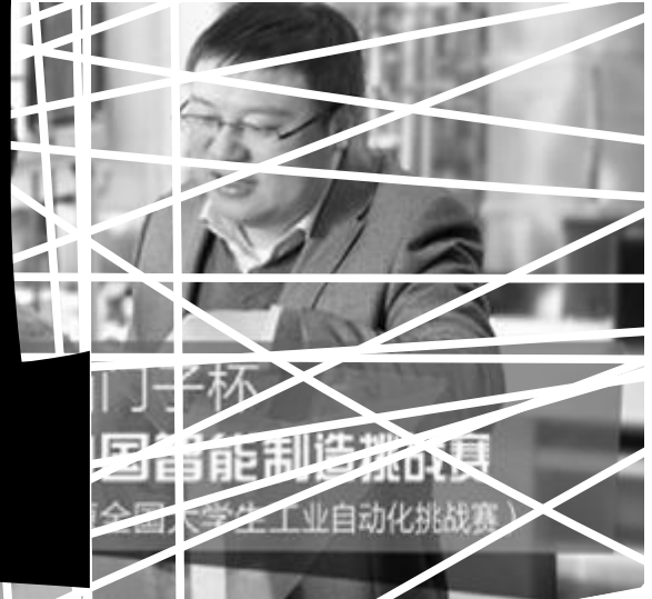
“一杯” 全国大学生工业自动化挑战赛

你们还记得吗？初入大学时的迷茫与探索，图书馆里的求知若渴，实验室里的废寝忘食，运动场上的挥洒汗水。这些记忆构成了你们最美好的青春年华。母校永远是你们坚强的后盾，永远是你们心灵的港湾。