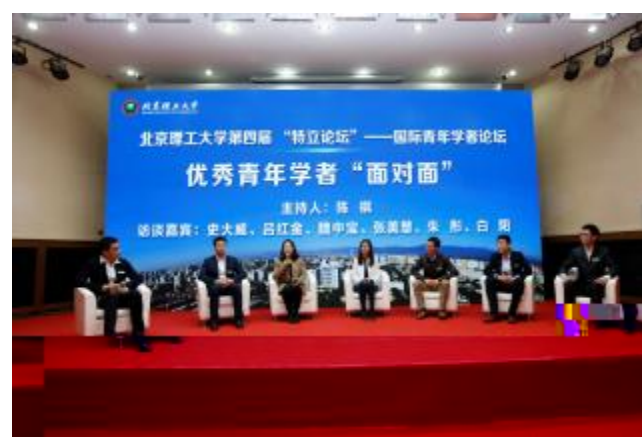
(上接第 1 )

中 ! 法 J y , 中 N 法 大 J 以 及 ! 事 法 K < , 中 N 法 大 J ! 法 J K , 家 | < _ M 法 同 新 中 心 共 同 C 2019 P ! 事 法 K 法 ( ) 4 3 Q 22 8 3 Q 24 8 在 中 N 法 大 J 平 G B . FG > M X > ? , 杨 , V , 以 及 J 生 组 成 C 代 表 , 荣 获 q . ( 法 J K 杨 )