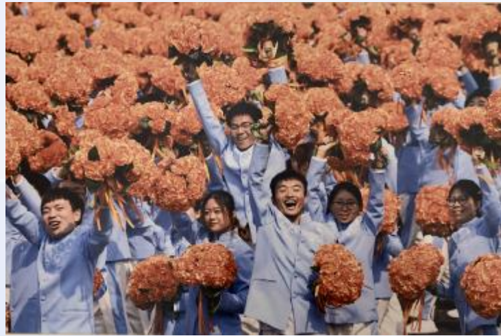
◀2019年10月1日,新中国成立70周年庆祝活动中,北京理工大学师生组成的“与时俱进”群众游行方阵通过天安门广场。

着B; 的, 一 T-34 “ ” 新的国 H 上 >; 中 的徐特立 , 中 , 生 , 。 一; 一 ~, 出北 理工大学 这 中国 党创 的第一 理工科大 学、新中国第一 国 工业院校的 。 , ! ”。## 80年, I $、校%&'、校O<(, 这 ) * +中诞生的大学, 不立 &' 人初 , , 党育人、 国育 / 。