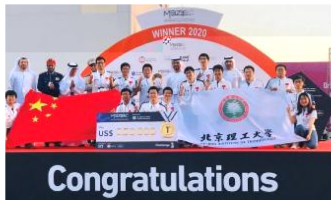
! 2020年2月25日，北理工“飞鹰队”在阿联酋阿布扎比举办的穆罕默德·本·扎耶德国际机器人挑战赛上夺得冠军 具备全新高水平实验平台的北理工微纳量子光子实验中心